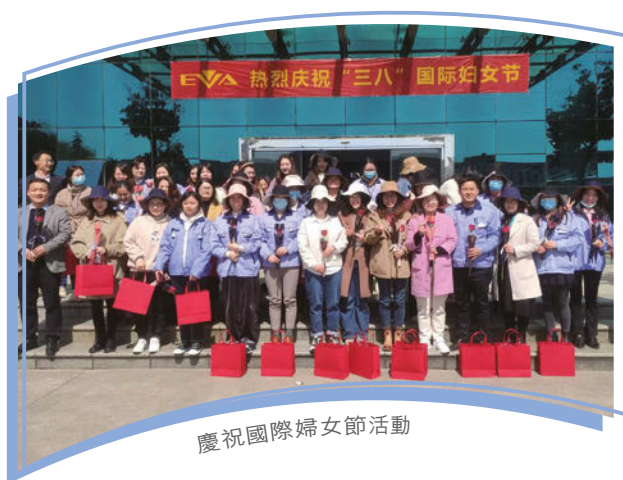
慶祝國際婦女節活動

本集團鼓勵僱員積極參與平衡工作與生活的活動和社區服務，其中包括體育和文化活動、義務工作服務及由慈善團體所舉辦的活動。本集團提供各類活動，透過慶祝端午節及中秋節等節日或組織社交活動來慶祝員工生日，從而建立相互支持和信任的團隊。在後疫情時代，我們繼續支持僱員採取靈活的工作安排，包括選擇遙距工作。儘管上半年面臨新冠肺炎疫情迅速蔓延的巨大挑戰，但本集團仍嚴格遵守當地政府的防疫措施，在正常及特殊情況(如隔離安排)下為僱員提供醫療用品。我們的僱員亦每天進行新冠病毒聚合酶連鎖反應(「核酸」)檢測，以防止在工作場所感染。