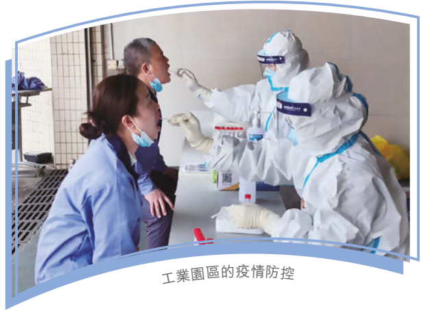
工業園區的疫情防控

在疫情持續肆虐的情況下，我們始終將僱員及利益相關人士的安全和健康放在首位。如今，我們在工業園營運中實施的疫情防控措施獲得國家表彰。為了保障大家的健康，我們專門建立虛擬通信渠道，暢通團隊與客戶的溝通。我們遵循地方政府的預防措施，加強員工靈活工作安排。在疫情發展的各個階段，本集團及時給予僱員最新的行政指導，並建議僱員於返工前定期檢測體溫。為進一步支持日後疫情應對，本集團繼續向僱員發放口罩及快速檢測試劑盒，以防止工作場所內的疫情傳播。