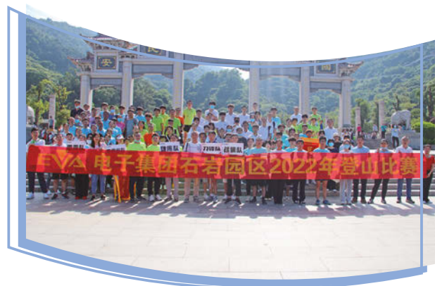
二零二二年登山比賽

在本集團內部，我們已正式制定員工手冊，列明有關薪酬及解僱、招聘及晉升、工時、休息時間、圍繞多元化和包容性的僱員福利及主題的政策及規程。為改善及促進多元化和包容性，本集團持續定期舉辦團隊建設活動。出於改善目的，本集團每年會根據市場情況和業務策略對所有舉措進行審查。本集團已制定薪酬及表現管理制度、薪酬政策及花紅制度，按員工的工作經驗、資歷、個人表現及市況向員工提供薪金。員工花紅乃基於彼等的自我績效評估、各相關業務部門的營運表現以及本集團總體營運業績進行評估。