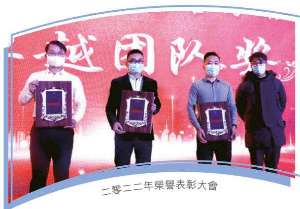
二零二二年榮譽表彰大會