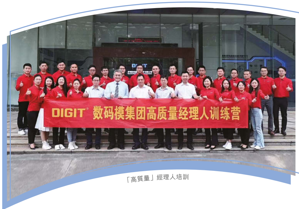
「高質量」經理人培訓