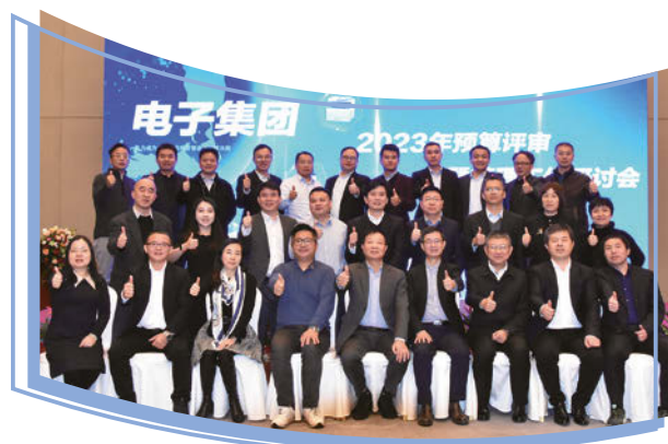
二零二二年預算評審及管理工作研討會