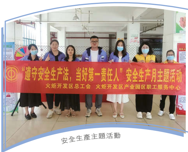
安全生產主題活動