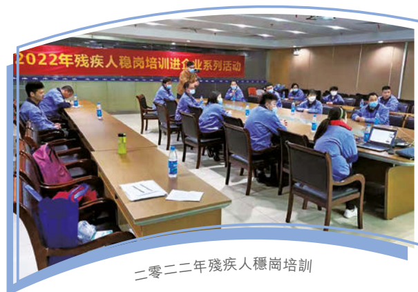
二零二二年殘疾人穩崗培訓

本集團的整體性別多元化為男女僱員比例67% / 33%。金屬和塑膠模具及零部件製造行業在公平性別體現方面持續面臨結構性障礙。為解決該首要問題，我們致力營造更為包容的工作環境。我們工業園內高度自動化的沖壓機械、機械臂及遠程控制激光焊接工作台均是提高工作環境包容性的重要優勢。我們的工業園實現高度自動化作業，藉此創造對體力要求較低的工作環境，從而為提高員工隊伍多元化製造機會，包括提高女性僱員比例、招募殘障員工及擴大年齡範圍。本集團現有一支不同年齡範圍、種族及國籍的員工隊伍。我們的中國團隊包括來自本地及世界各地的人員，位於越南及墨西哥的海外工業園亦實現高度本地化，以期促進文化交流。同時，本集團致力維持員工隊伍中的殘障人員比例。此外，我們注重員工的整體身心健康及工作滿意度。年內，本集團的蘇州工業園組辦殘障培訓工作坊，旨在提升殘障員工的職業健康及安全。