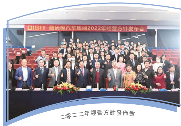
二零二二年經營方針發佈會

我們重視員工的事業發展。為實現這一目標，本集團為僱員提供各種廣泛的培訓以履行支持彼等事業發展的承諾。我們為新入職的僱員提供入職培訓及一套全面及有系統的完整培訓，幫助彼等瞭解及熟悉我們的行業、企業文化及員工政策，尤其涵蓋反貪污、行為及職業道德守則等議題。此外，我們為所有僱員，包括前線職工到高級管理人員(包括執行董事)提供持續培訓，藉此更新及拓展彼等的知識及技能。僱員在修讀其他機構主辦與工作相關的課程時，亦可獲得教育資助。除提供有關具體工作技能方面的培訓外，本集團相信，若能深入瞭解市場狀況、行業趨勢及經濟前景，對我們的管理人