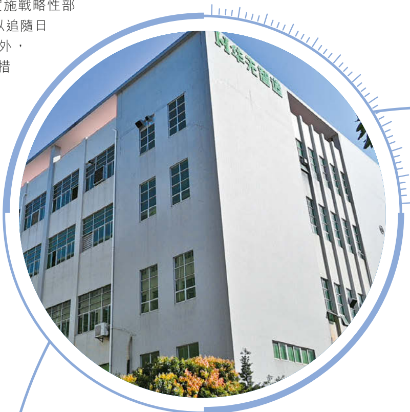
深圳華先智造科技有限公司

越南方面，自工業園於二零一七年投產，業務急速發展，營業額年內同比上升123.7%。升幅主要由於本集團數年前實施戰略性部署，將若干日系客戶的訂單從中國轉移至越南，以追隨日系客戶的步伐將生產基地擴展至東南亞地區。此外，由於越南政府於二零二二年第一季度率先放寬防疫措施，本集團抓住了越南的防疫放寬和經濟復蘇的機遇，使越南工業園的生產力從年初的疫情爆發期迅速地提升起來，以致出貨量由二零二二年三月開始飆升。越南的訂單現時已經超出產能負荷，為了在短時間內迎合客戶的需求，本