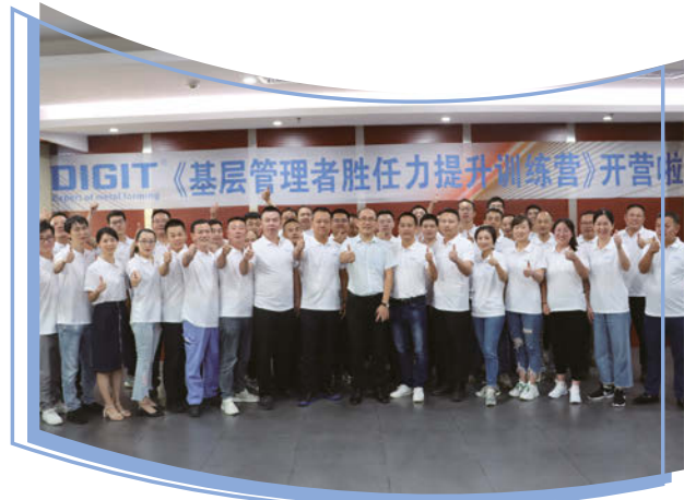
基層管理者勝任力提升訓練營

於報告期間，本集團向高級管理人員(包括執行董事)所提供的培訓包括互動培訓課程、科技論壇及戰略研討會，讓本集團不同部門的管理人員共聚一堂，分享經驗，藉此促進管理團隊中的跨部門交流。此外，本集團亦遵守企業管治守則第C.1.4條及上市規則第3.29條項下有關董事及公司秘書的專業發展和培訓的規定。