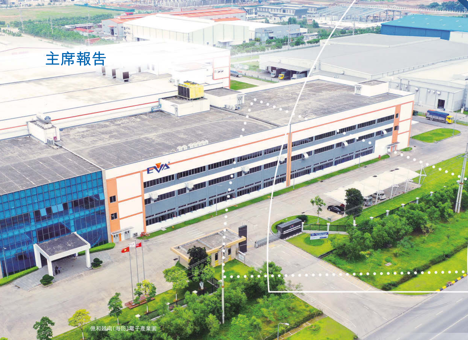
億和越南(海防)電子產業園